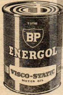
BP Energol "Visco-Static"

Arabanızdan daha iyi randıman almak için